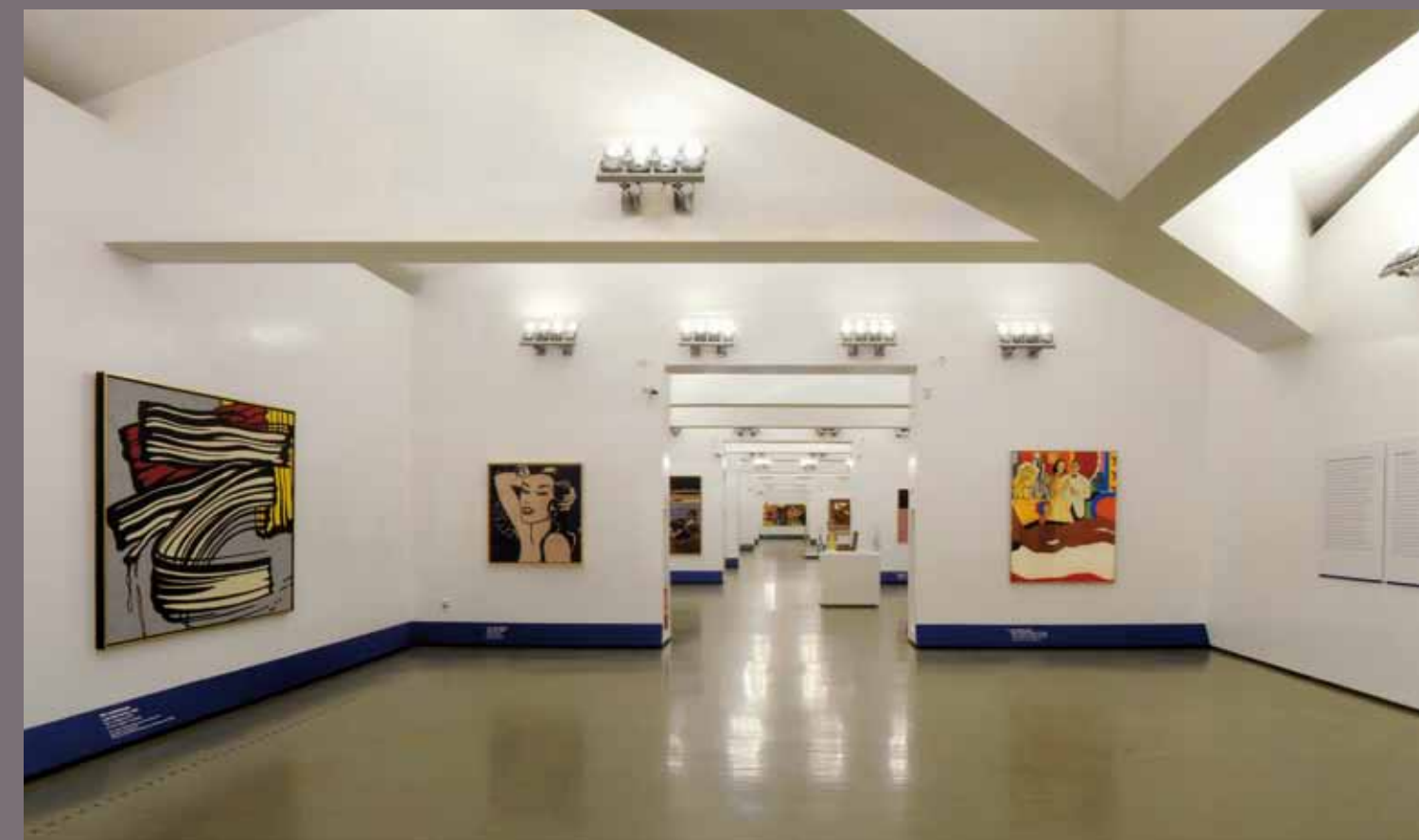
Pop Art! 1956 - 1968

Nel corso degli anni le linee guida che legano, con scientifica continuità, la scelta delle mostre e la loro programmazione alle Scuderie si incentrano su un programma di divulgazione dell'arte italiana classica e moderna (si pensi, solo per citarne alcune, alle grandi mostre dedicate a Caravaggio, Antonello da Messina, Lorenzo Lotto, Filippino Lippi e Sandro Botticelli, Tintoretto, Tiziano) nonché sulla riflessione approfondita e innovativa sui rapporti reciproci tra l'Italia e la grande arte internazionale (in questa ottica Maestà di Roma, Rembrandt, Metafisica, Velazquez, Bernini, Luca Giordano, Da Giotto a Malevic. La reciproca meraviglia, Dürer e l'Italia), e su grandi progetti dedicati alla storia dell'arte mondiale (come Vermeer. Il secolo d'oro dell'arte olandese e Frida Kahlo). Sono straordinari eventi espositivi - insieme a tutti gli altri che costituiscono il programma svolto fino ad oggi - che hanno sempre il pregio di una doppia lettura: mostre estremamente godibili e comprensibili per il pubblico e, nello stesso tempo, storicamente e artisticamente rigorose ed innovative.