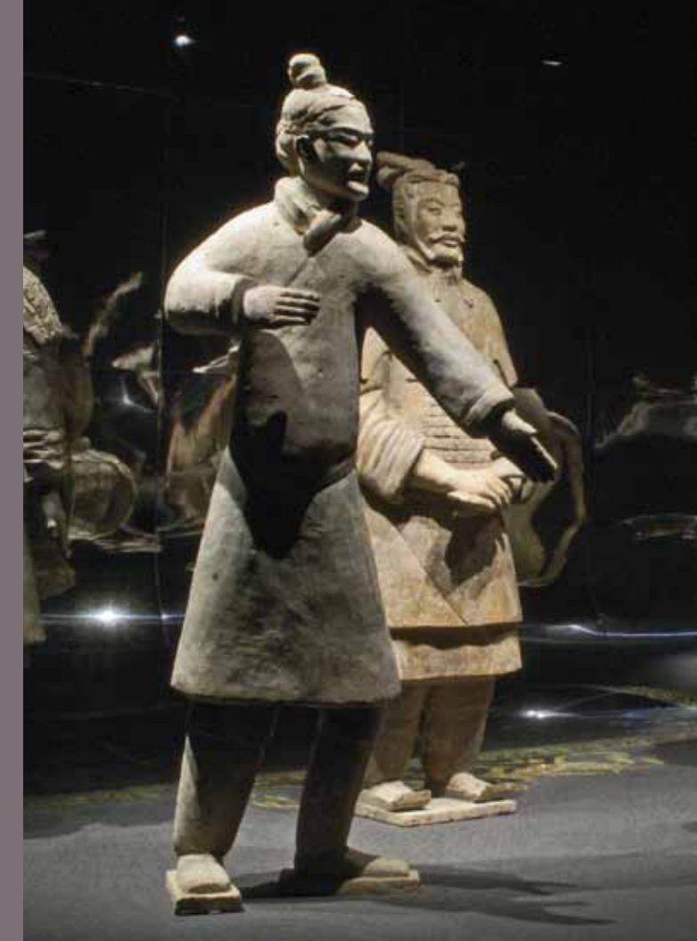
Cina. Nascita di un impero

Over the years guidelines adhered to with scientific stringency and continuity when choosing topics for exhibitions at the Scuderie, include a program for boosting appreciation of both classical and modern Italian art (one has but to think of the splendid exhibitions devoted to Caravaggio, Antonello da Messina, Lorenzo Lotto, Filippino Lippi e Sandro Botticelli, Tintoretto, Tiziano) and an innovative and in-depth look at the relationship between Italy and the best in international art (with such exhibitions as the Majesty of Rome, Rembrandt, the Metaphysical School, Velazquez, Bernini, Luca Giordano, From Giotto to Malevic: Mutual Wonder, and Dürer and Italy), and major projects devoted to the history of world art (such as Vermeer. The Golden Century of Dutch Painting, and Frida Kahlo). These stunning events, along with all the others that have gone to make up the program of exhibitions held to date, always play the dual role of being both enjoyable and of immediate interest to the wider public while, at the same time, being historically and artistically stringent and innovative from the scholarly standpoint.