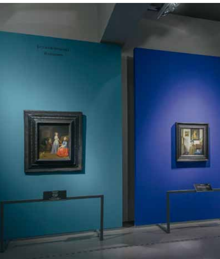
Vermeer. Il secolo d'oro dell'arte olandese

Nel corso degli anni le linee guida che legano, con scientifica continuità, la scelta delle mostre e la loro programmazione alle Scuderie si incentrano su un programma di divulgazione dell'arte italiana classica e moderna (si pensi, solo per citarne alcune, alle grandi mostre dedicate a Caravaggio, Antonello da Messina, Lorenzo Lotto, Filippino Lippi e Sandro Botticelli, Tintoretto, Tiziano) nonché sulla riflessione approfondita e innovativa sui rapporti reciproci tra l'Italia e la grande arte internazionale (in questa ottica Maestà di Roma, Rembrandt, Metafisica, Velazquez, Bernini, Luca Giordano, Da Giotto a Malevic. La reciproca meraviglia, Dürer e l'Italia), e su grandi progetti dedicati alla storia dell'arte mondiale (come Vermeer. Il secolo d'oro dell'arte olandese e Frida Kahlo). Sono straordinari eventi espositivi - insieme a tutti gli altri che costituiscono il programma svolto fino ad oggi - che hanno sempre il pregio di una doppia lettura: mostre estremamente godibili e comprensibili per il pubblico e, nello stesso tempo, storicamente e artisticamente rigorose ed innovative.