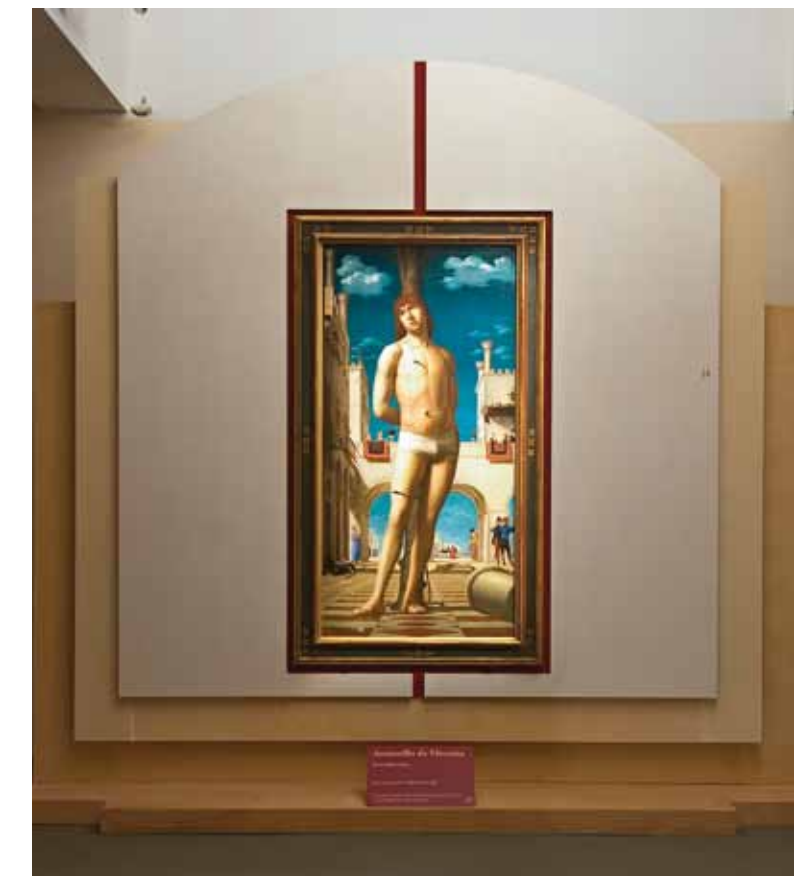
Antonello da Messina

On 21 December 1999 the beautifully restored Scuderie were officially inaugurated by the President of the Republic, with the Mayor of Rome and the Minister of Cultural Heritage by his side. The first exhibition was entitled 100 Masterpieces from the Hermitage. Rather than simply a collection of old masters, the exhibition bore witness to the history of early 19th century taste in collecting. It was also the first time that such a broad selection of works of art from the famous Russian museum had ever left their St. Petersburg home. Some 100 paintings and drawings by Degas, Monet, Renoir, Cézanne, Gauguin, le Douanier Rousseau, Vlaminck, Derain, Vallotton, Vuillard, Sisley, Pissarro, Matisse and Picasso were hosted by the Scuderie until June 2000.