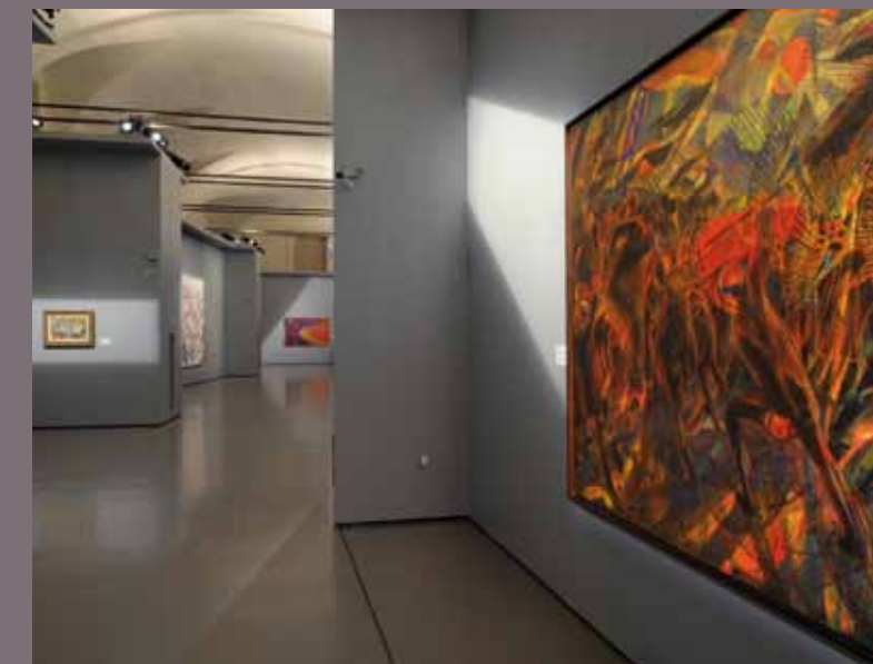
Futurismo. Avanguardia Avanguardie

Sulla base di un concorso internazionale, viene scelta l'architetto Gae Aulenti per la progettazione delle opere necessarie al recupero dell'intero edificio e all'allestimento degli spazi. E le Scuderie del Quirinale che oggi cittadini romani, turisti italiani e stranieri frequentano con familiarità ed assiduità - 35 mostre in poco più di 13 anni - sono quelle che Gae Aulenti ha rinnovato, in accordo con la Sovrintendenza di Roma, allestito in tempi da record per l'anno Duemila grazie all'Agenzia Romana per la Preparazione del Giubileo e che Roma Capitale ha affidato all'Azienda Speciale Palaexpo.