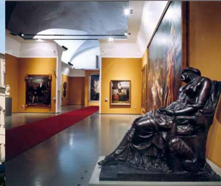
Maestà di Roma

An international competition for the restoration of this historic building and for designing its new exhibition areas was won by architect Gae Aulenti, and the Scuderie del Quirinale, to which Italian and foreign visitors alike flock with affection and enthusiasm today (it has hosted 35 exhibitions in just over 13 years!), were born. Working in conjunction with the Rome Fine Arts Superintendency, Ms. Aulenti restored the building in record time for Jubilee Year 2000, thanks also to the Rome Agency for the Jubilee Preparations; and the Rome Municipal Authority appointed the Azienda Speciale Palaexpo to manage the new Scuderie on its behalf.