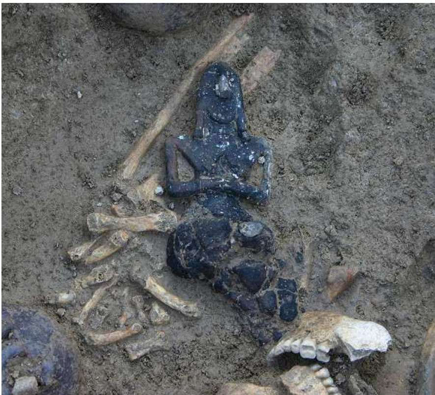
La statuette femminile in corso di scavo